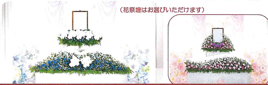
(花祭壇はお選びいただけます)